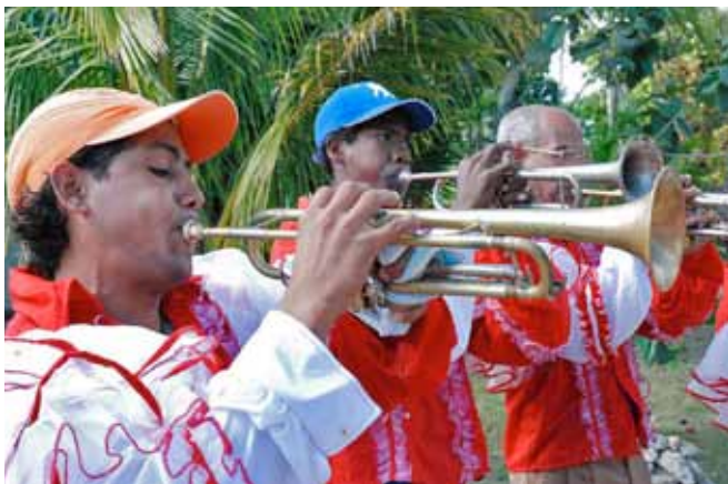
En fanfar för brigaden!