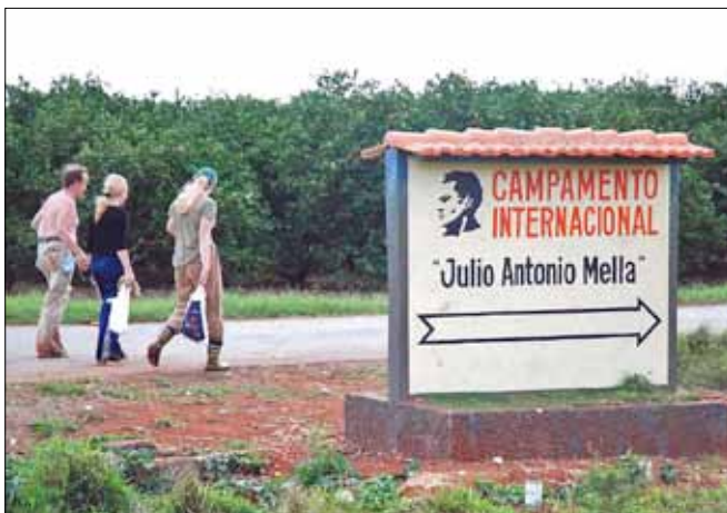
Till Kuba med Solidaritetsbrigad

Senare under 1990-talet och nu på 2000-talet har arbetsuppgifterna till största delen varit olika slags jordbruksarbete. Det kan vara skörd av frukt eller rensnings- och gallringsarbete.