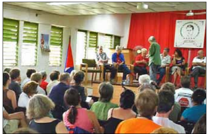
Föreläsningssalen i lägret