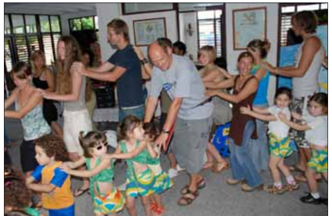
Studiebesök på ett daghem som avslutas med dans