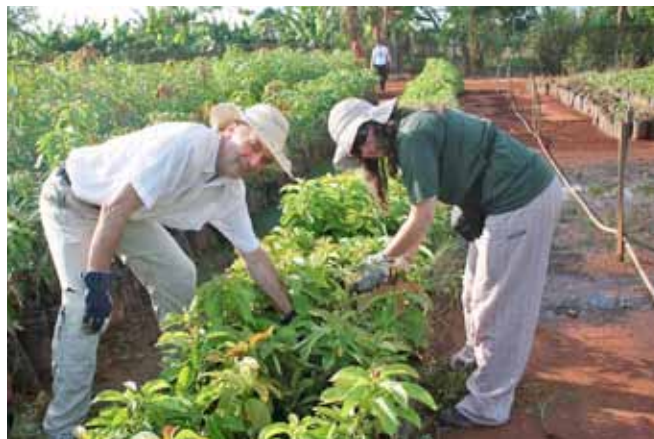
Brigaden arbetar på en planskola

I brigadprogrammet ingick en resa till Playa Girón, där de hårdaste striderna ägde rum. Vi bodde tre nätter på Hotel Playa Girón, och hann med ett besök på bl. a. krigsmuséet, en lokal vårdcentral, och en trevlig fest hos en CDR-kommitté. På återresan till brigadlägret besökte vi Santa Clara med Che-mausoléet och det