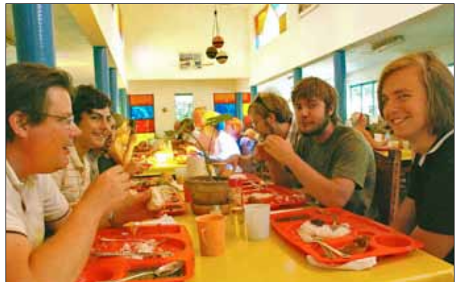
Stämningen i matsalen är god när man är hungrig