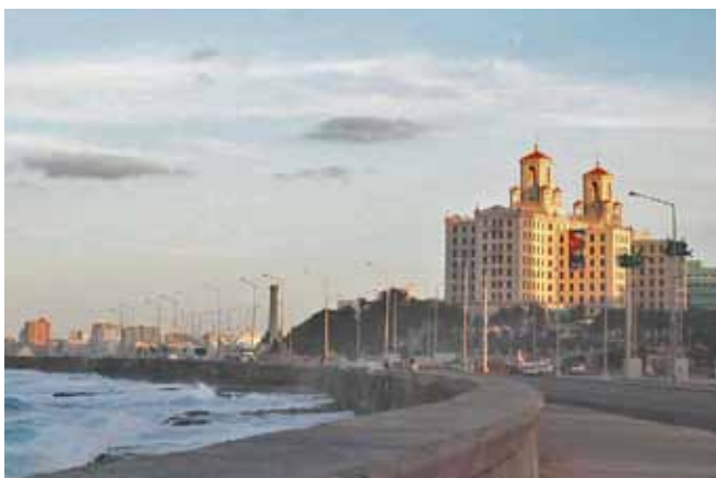
Havannas strandgata Malecon i skymningen