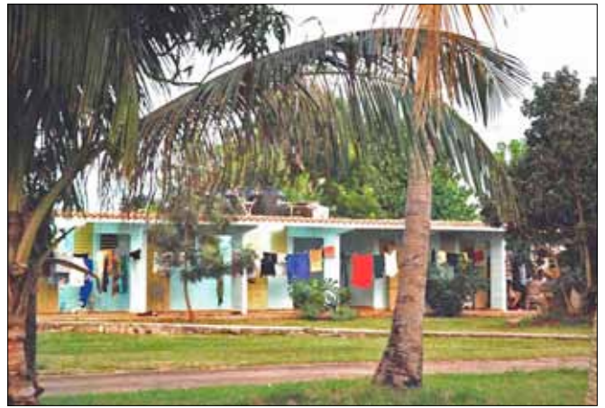
Man bor i 6-bäddsrum med utgång direkt till lägrets parklandskap

Under vinterbrigaden infaller Revolutionsdagen den 1 januari; också detta en dag som firas i hela landet.